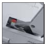
Dispositif de blocage de lame