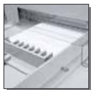
Carter de protection arrière

Massicot de bureau haut rendement pour une utilisation manuelle. Coupe des grands formats jusqu'à 475 mm de longueur et des piles de papier jusqu'à 70 mm d'épaisseur