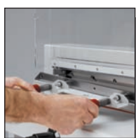
Dispositif de sécurité protégeant la lame lors de son remplacement