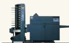
BST10-d main + BDF