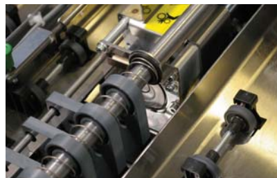
Détail du couteau rotatif

Sans coupe ni rainage, le BCMx convoie les feuilles jusqu'au module de finition.