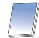
Blocs (agrafage à plat)